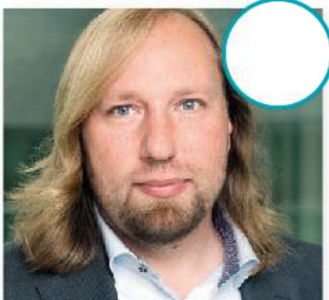
Dr. Anton Hofreiter (Grüne)

Falls er nicht Verkehrsminister wird. Die grüne Gesundheitsministerin Andrea Fischer (1998 bis 2001) war Druckerin, er ist immerhin Biologe!