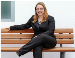
Alexandra Ulbrich Media Service