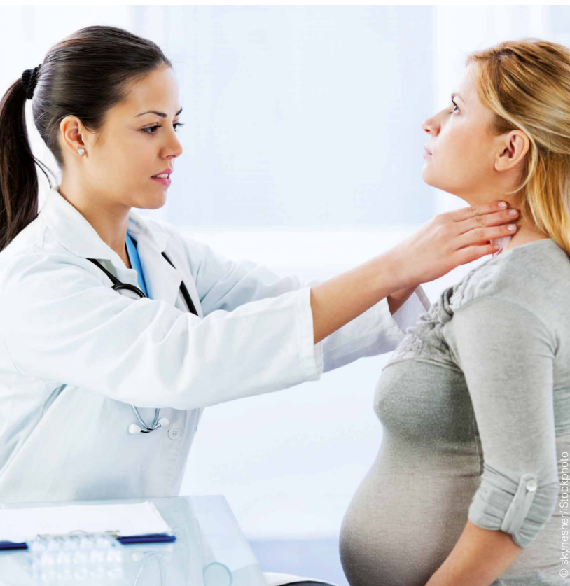
Die häufigste und bekannteste Folge des Jodmangels ist die Entwicklung einer Struma.